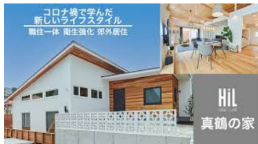
HIL真鶴の家 (DIYスマートホーム設計)

異業種コラボも加速。B2B展示会、B2Cイベントなどでのコラボセミナーや出展なども