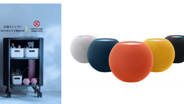
Apple HomePod mini