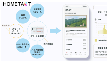
HOMETA CT HEMS連携イメージ