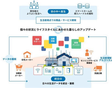
HAUS UPDATAプロジェクト：電通×日鉄興和不動産+参画企業ほか十数社