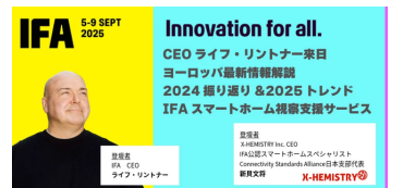
X-HEMISTRY × IFA