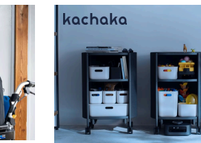
スマートファニチャーKachaka