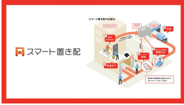
ライナフ スマート置き配

インテリア性のあるデバイスや家電が増加傾向に。住宅設計上の設置箇所、収納、配線考慮、コンセントの位置・数、ネットワーク環境や照明器具選定などの多角的な視点で意匠面や生活体験を最適化する設計力が求められています。設置設定サービスの利活用も業界DXに貢献します。