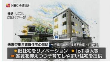
LIXIL×長崎県 すみよかプロジェクト