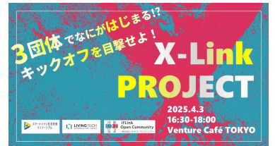
特別会員3団体コラボレーション共創プロジェクト