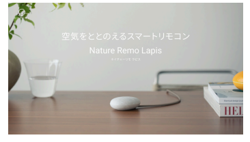
Nature Remo Lapis