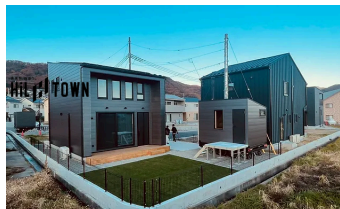
HILタウン山梨 (HEMS/B2Bスマートホーム)