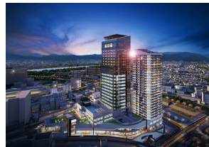
三菱地所×ライナフ×DXYZ