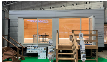
エリアノ：次世代トレーラーハウス